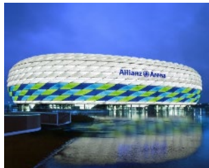
ALLIANZ ARENA München (Alemanha)

Exemplos de edifícios em que foi usado o produto PENOSIL Silicone neutro C-22: