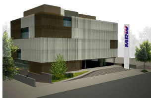
MRW – Sede Corporativa Barcelona (Espanha)