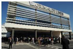
Terminal Grimaldi – Porto de Barcelona (Espanha)