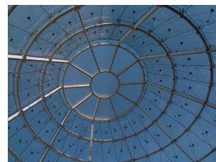
Reserve Bank Pretoria (África do Sul)